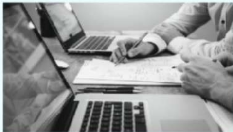
SANAL SINIF VIRTUELLER KLASSENRAUM