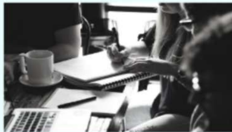
DİJİTAL GERİBİLDİRİM DIGITALE EVALUATION