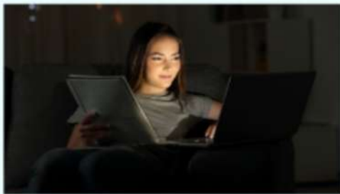
CANLI DERS ONLINE UNTERRICHT